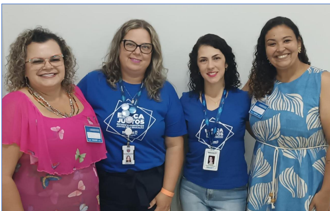
OFICINA COM AS TÉCNICAS DO NCPM