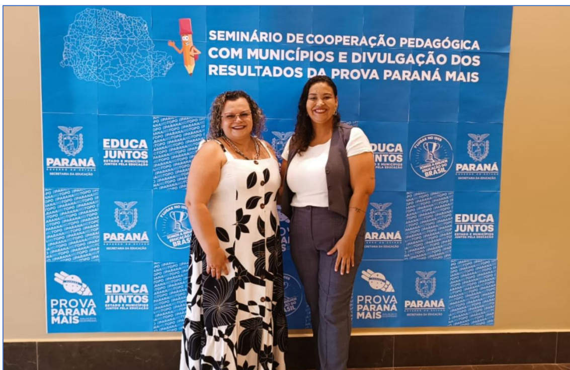
SEMINÁRIO DE COOPERAÇÃO PEDAGÓGICA