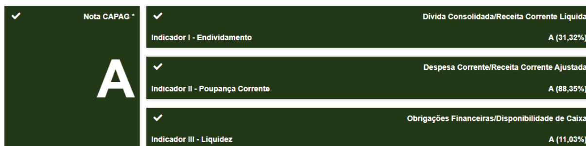
Figura 02 – Capacidade de Pagamento (CAPAG) de Morretes, 2022.