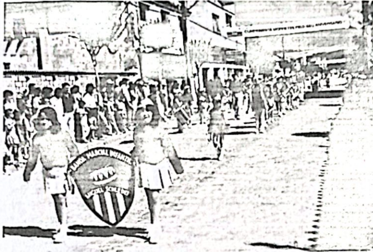
FOTO DA BANDA MARCIAL INFANTIL MIGUEL SCHLEDER ANO - 1987